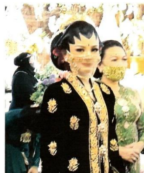
Gambar 4. Saat Perias pengantin Nganti Pengantin