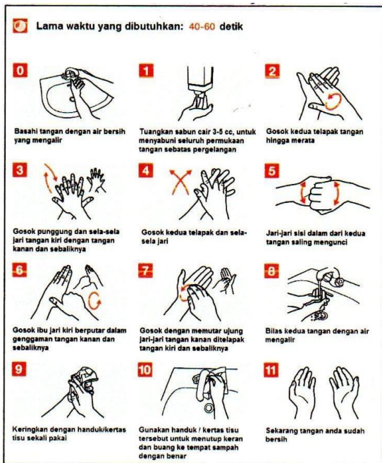
Gambar 1. Cara Mencuci Tangan dengan Air Mengalir.

Berikut ini petunjuk cara mencuci tangan dengan air mengalir: