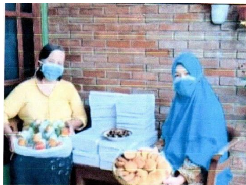
Gambar 7. Saat Perias Ganti Menawarkan Apem Kepada Pelanggan.