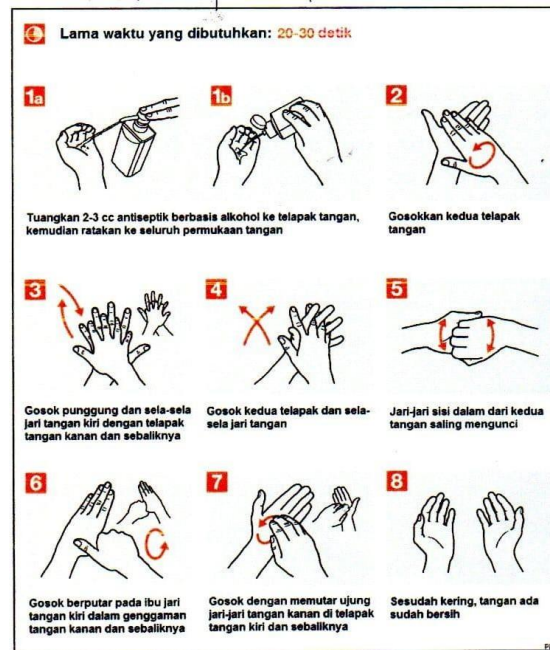
Gambar 2. Cara Mencuci Tangan dengan Hand Sanitizer.

Berikut ini petunjuk cara mencuci tangan dengan hand sanitizer: