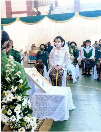
Gambar 5. Saat Perias Menunggu Ijab