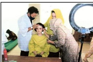
Gambar 3. Saat Perias Merias pengantin

Berikut ini data hasil dokumentasi tentang perias pengantin saat merias.