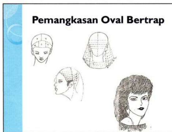
Gambar 5. Pemangkasan oval bertrap