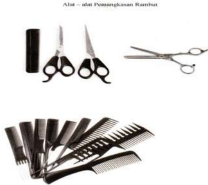
Gambar 1. Alat pemangkasan rambut

keindahan rambut yang kita miliki. Pengetahuan tentang seni memangkas rambut merupakan tindakan memperindah suatu mode tatanan rambut dengan jalan mengurangi panjang rambut dengan mempertimbangkan bentuk wajah dan trend pemangkasan rambut.