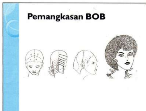
Gambar 3. Pemangkasan BOB