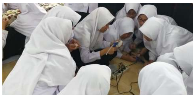
Gambar 4. Foto Pelatihan