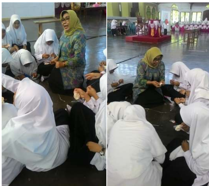
Gambar 3. Foto pelatihan