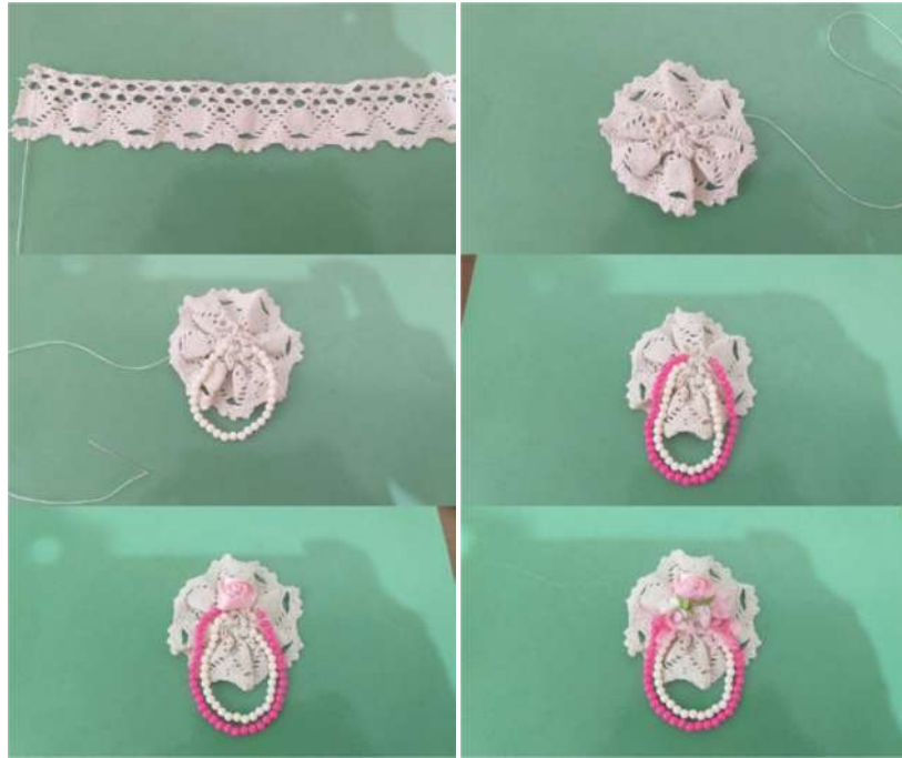
Gambar 1. Foto Proses