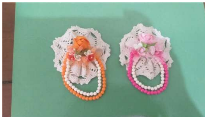
Gambar 5. Foto Hasil