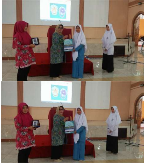
Gambar 6. Foto Serah Terima Kenang-Kenangan