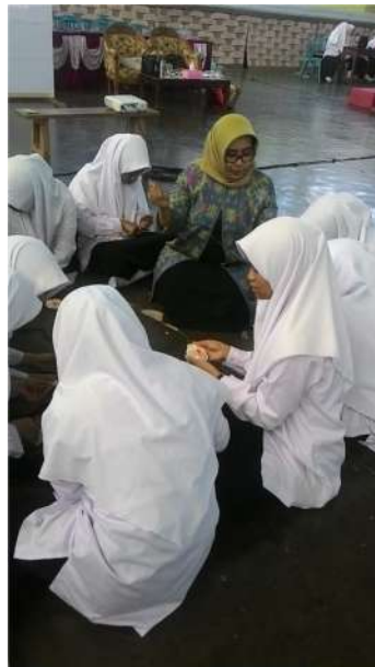
Gambar 2. Foto Pelatihan