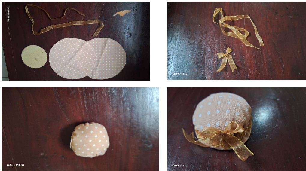
Gambar 2. Proses Pembuatan Souvenir dengan Kain Perca

Latihan peserta dilakukan secara berkelompok untuk mempermudah tutorial serta pengecekan proses pembuatan souvenir dari kain perca.