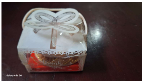
Gambar 3. Packing Souvenir

Menambah ketrampilan Ibu-ibu Penggerak PKK Kalurahan Srimulyo Bantul. Kegiatan Pengabdian Pada Masyarakat ini dilaksanakan oleh dosen program studi Desain Busana beserta mahasiswa Akademi Kesejahteraan Sosial “AKK” Yogyakarta sebagai nara sumber yang pada saat pelatihan Ibu-ibu Penggerak PKK sangat antusias dalam mengerjakan pembuatan souvenir dari kain perca, kami memberikan bimbingan dengan penuh kesabaran serta semangat dengan melihat antusias Ibu-ibu PKK. Kami pun sebagai nara sumber merasa puas dengan melihat hasil souvenir dari kain perca yang telah dibuat oleh Ibu-ibu penggerak PKK di kalurahan Srimulyo Bantul Yogyakarta.