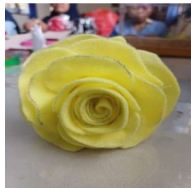
Gambar 4. Hasil jadi bunga mawar dari flanel