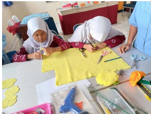
Gambar 2. Menggambar pola bunga mawar pada flanel