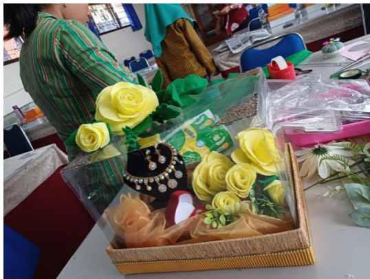
Gambar 5. Di terapkan pada mahar mas kawin