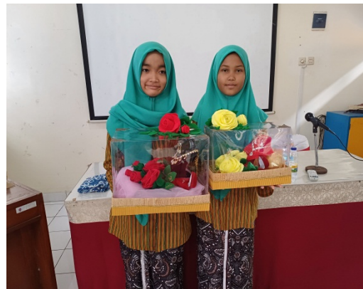
Gambar 6. Hasil jadi pada mahar mas kawin