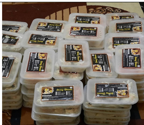
Gambar 6. Hasil jadi

Selanjutnya adalah pelatihan dalam menghitung harga jual produk yang sudah dibuat. Harga jual adalah besaran harga yang dibebankan kepada konsumen. Besaran biaya ini dihitung dari biaya produksi, non produksi, dan laba. Cara menentukan harga jual dimsum dalam satu kali produksi adalah sebagai berikut :