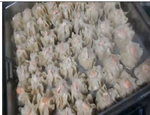
Gambar 4. Proses pengukusan