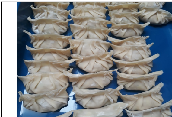
Gambar 3. Proses pelipatan

Dimsum melalui proses pengolahan dari awal sampai dengan pengemasan membutuhkan waktu sekitar 3 jam. Ada beberapa titik kritis yang harus diwaspadai dalam pembuatan dimsum agar hasil yang dibuat maksimal. Titik kritis dalam pembuatan dimsum anatar lain 1) menggunakan bahan yang segar, daging ayam yang digunakan adalah daging yang segar dan menggunakan bagian paha dengan tekstur kenyal berotot dan memiliki kulit guna menambah tekstur dari dimsum; 2) proses penghalusan daging tidak boleh terlalu lembut, cukup menggunakan chopper dengan hasil yang kasar sehingga tekstur dimsum tetap berasa daging; 3) menggunakan takaran tepung yang lebih sedikit dari berat daging akan membuat dimsum lebih lembut, kenyal dan juicy ; 4) menggunakan bumbu yang minimalis agar dimsum tidak tertutup rasa bumbu yang menonjol; 5) pastikan dimsum dibungkus dengan kulit yang tipis dan transparan saat dikukus, maka dari itu pilih kulit yang tipis dan berbentuk bulat diameter 10 cm; 6) agar dimsum tampak lembab dapat disemprotkan air saat pengukusan sehingga kulit tidak kering; 7) kukus dimsum jangan terlalu lama cukup 10 menit saja agar sari-sari dari ayam tidak hilang; Guna memperjelas tabel dan diagram yang ada sebelumnya, gambar hasil pelatihan pembuatan dimsum dapat dilihat pada gambar dibawah ini.