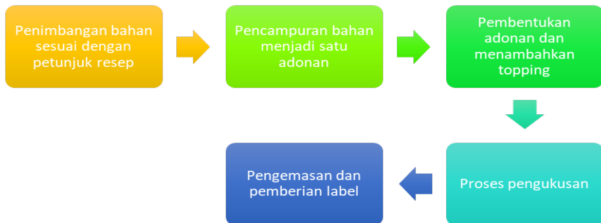
Gambar 2. Tahapan pembuatan dimsum

Setelah memperkenalkan bahan dan alat untuk pembuatan dimsum, tahap selanjutnya adalah tahap pengolahan dalam pembuatan dimsum. Tahapan pembuatannya dapat diperjelas dengan diagram alir dibawah ini.