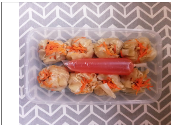
Gambar 5. Proses pengemasan