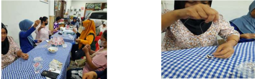
Gambar. 2. Pelaksanaan Pembuatan Konektor Masker

Pembuatan konektor masker manik-manik dilaksanakan dengan didampingi agar peserta dapat melakukannya dengan baik dan benar, karena diharapkan setelah pelatihan ini maka anggota UPPKS membuat dan menjualnya untuk menambah penghasilan mereka, sebagai anggota UPPKS peserta harus ikut membantu mengembangkan usaha mereka dengan selalu menambah pengetahuan, wawasan, dan keterampilan dengan mengikuti pelatihan-pelatihan. Diantara pelatihan itu adalah pembuatan konektor masker dari manik-manik. Peserta melaksanakan secara serentak pelatihan tersebut dan peserta merasa senang dalam mengerjakan pembuatannya. Diharapkan dalam mengikuti pelatihan-pelatihan ini yang diadakan oleh siapapun peserta tidak bosan mengikutinya dan dapat merupakan kegiatan rutin yang setiap saat dapat diikuti.