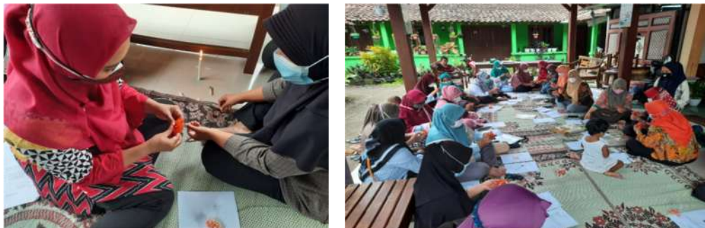
Gambar 2. Pelaksanaan pembuatan assesories

Pelaksanaan pembuatan aksesoris dengan mendampingi peserta agar dapat melakukan langkah kerja pada pembuatan bros akrilik. Pembuatan ketrampilan tersebut diharapkan dapat menambah wawasan, pengetahuan, dan ketrampilan peserta pelatihan. Diharapkan setelah melakukan praktik pembuatan aksesoris ini, peserta di rumah dapat mengembangkan sendiri dengan model-model yang lainnnya. Pelaksanaan pembuatan aksesoris yang dilakukan secara bersamaan oleh seluruh peserta. Peserta sangat antusias dalam mengerjakan pembuatan aksesories. Ketrampilan yang diberikan diharapkan dapat menambah kreativitas masyarakat, dan mampu menjadi kegiatan rutin yang dapat menambahkan hasil tambahan dalam perekonomian.