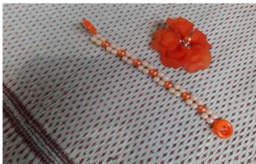
Gambar 3. Hasil aksesoris

Pelaksanaan pembuatan aksesoris dengan mendampingi peserta agar dapat melakukan langkah kerja pada pembuatan bros akrilik. Pembuatan ketrampilan tersebut diharapkan dapat menambah wawasan, pengetahuan, dan ketrampilan peserta pelatihan. Diharapkan setelah melakukan praktik pembuatan aksesoris ini, peserta di rumah dapat mengembangkan sendiri dengan model-model yang lainnnya. Pelaksanaan pembuatan aksesoris yang dilakukan secara bersamaan oleh seluruh peserta. Peserta sangat antusias dalam mengerjakan pembuatan aksesories. Ketrampilan yang diberikan diharapkan dapat menambah kreativitas masyarakat, dan mampu menjadi kegiatan rutin yang dapat menambahkan hasil tambahan dalam perekonomian.