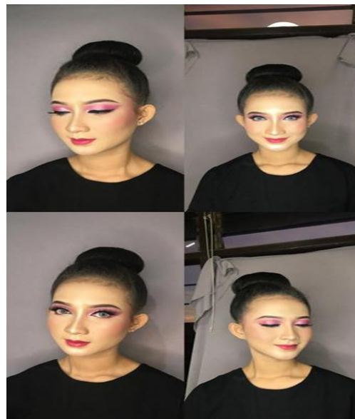
Gambar 4. Perbaikan pada gradasi pengolesan eyeshadow dan blush on