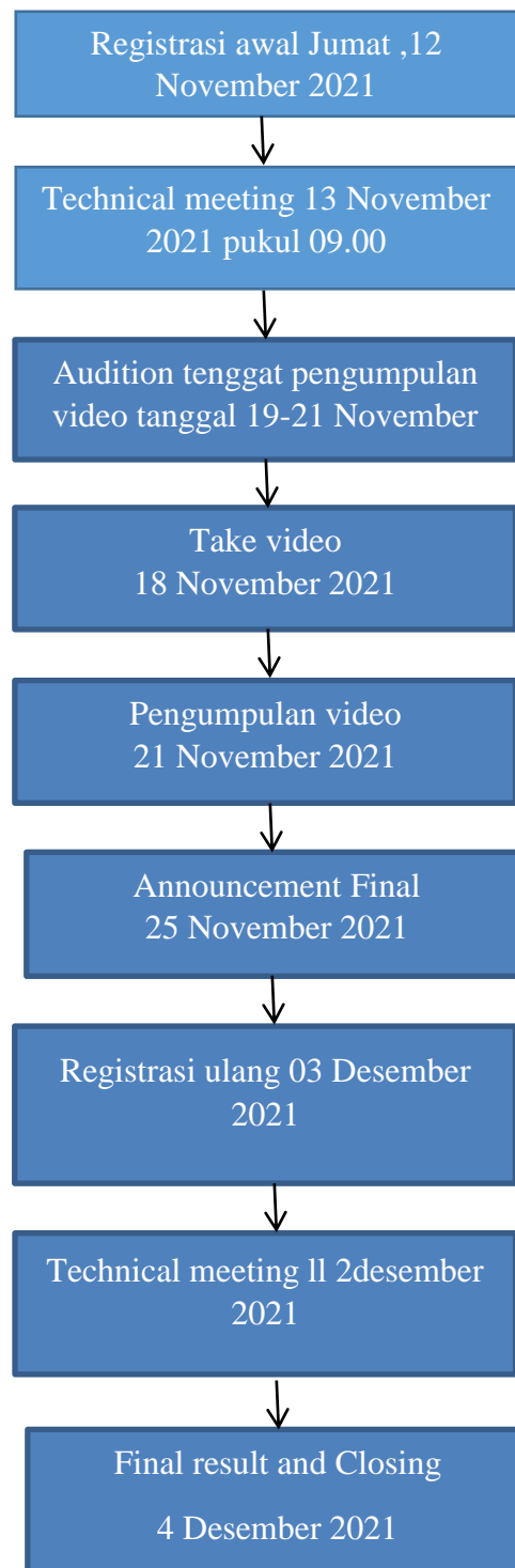
Gambar 7. Jadwal Pelaksanaan Lomba