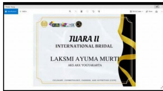
Gambar 9. Sertifikat kejuaraan