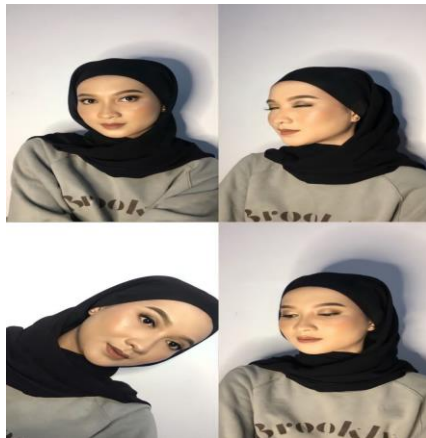
Gambar 1. Hasil praktek menunjukkan total look belum maksimal