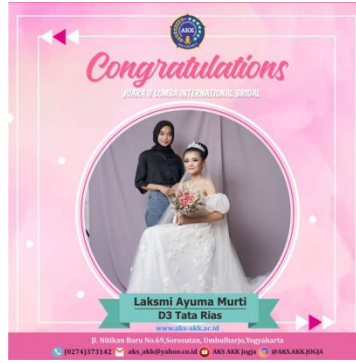
Gambar 8. Hasil Lomba Tata Rias Pengantin Internasional