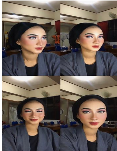
Gambar 3. Perbaikan pada pembauran warna eyeshadow