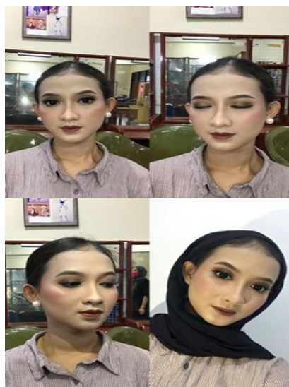
Gambar 2. Perbaikan pada gradasi warna eyeshadow